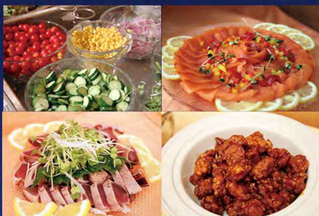
バラエティ豊かな料理の数々